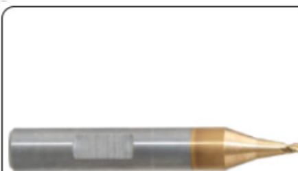
Cortador de 1.5mm