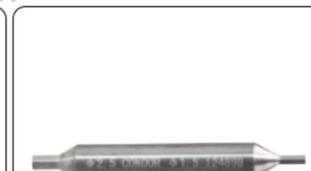
Guía doble cara