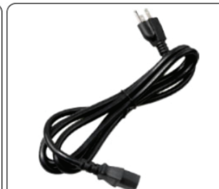
Cable de alimentación