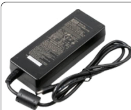
Cable de alimentación