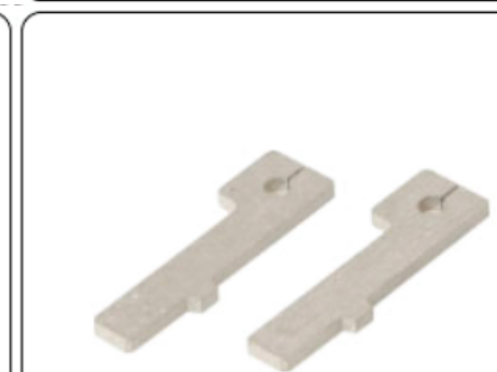
Tope de alineación